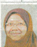
Pensyarah Kanan, Jabatan Kesihatan Awam, Universiti Putra Malaysia