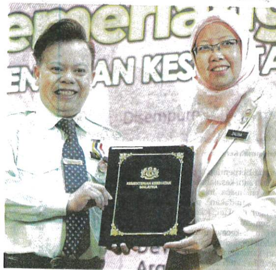
DR. ZALIHA ketika menyampaikan sijil perkhidmatan cemerlang kepada warga kerja KKM pada Majlis Anugerah Perkhidmatan Cemerlang 2022 di Putrajaya semalam.

"Pembentangan di Parlimen kelak akan menjadi titik tolak kepada hala tuju KKM untuk melihat perubahan dari perspek-