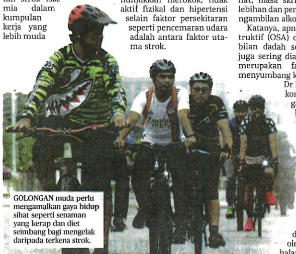
GOLONGAN muda perlu mengamalkan gaya hidup sihat seperti senaman yang kerap dan diet seimbang bagi mengelak daripada terkena strok.

“Gaya hidup yang tidak aktif, tabiat makanan tidak sihat, masa skrin berlebihan dan peningkatan pengambilan alkohol” Dr Kok